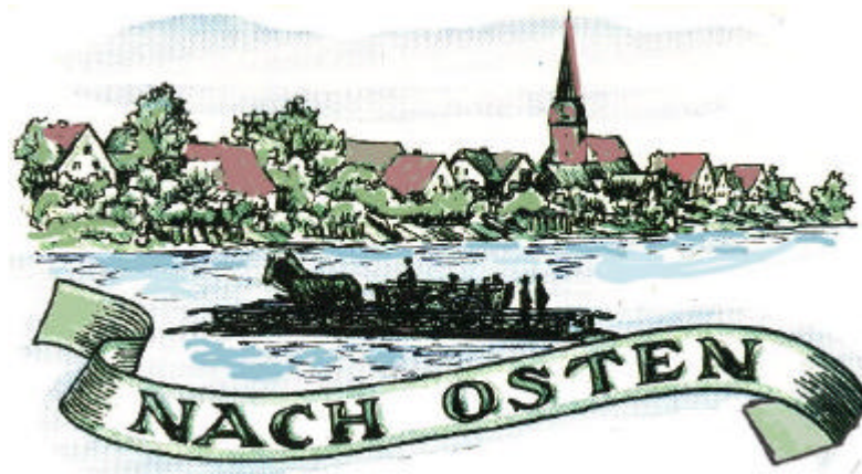
Kirchspiel im Erzbistum Bremen-Verden

Aus Kirchenregistern und von Familienforschern notiert und zusammengefügt