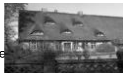
Hof Altendorf / Hamelwörden