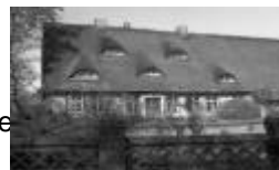
Hof Altendorf / Hamelwörden