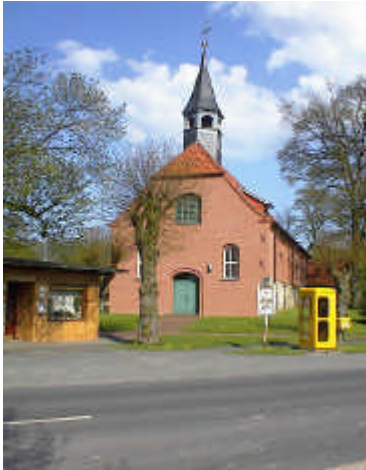
Kirche Hamelwörden (2001)